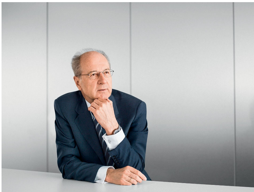
Hans Dieter Pötsch

Am 13. Mai 2019 traf sich der Aufsichtsrat zu einer weiteren Sitzung. Neben der Vorbereitung der 59. ordentlichen Hauptversammlung der Volkswagen AG am 14. Mai 2019 standen unter anderem der Börsengang der TRATON SE, der aktuelle Sachstand zur Dieseldispute sowie der Bericht des Monitors auf der Tagesordnung. Zudem erörterten wir mit dem Vorstand Überlegungen zur Entscheidung zum Aufbau eines neuen Produktionsstandortes.